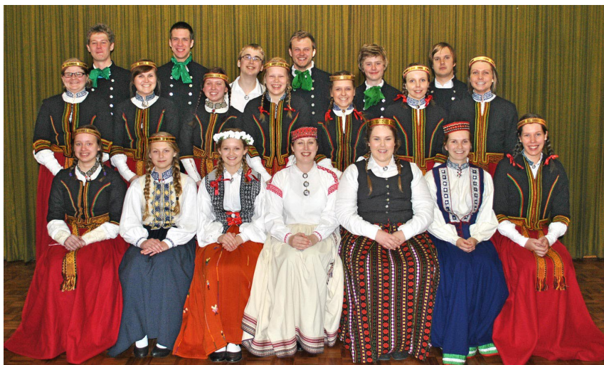
Tautas deju kopa „Ritenītis“.