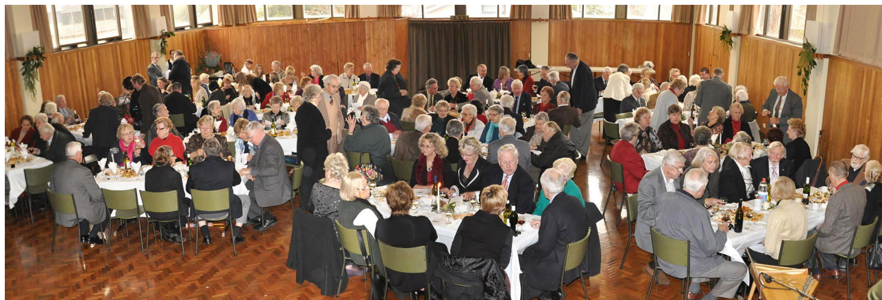
„Nama labad“ sarīkojuma apmeklētāji Melburnas Latviešu namā 2010. gadā.