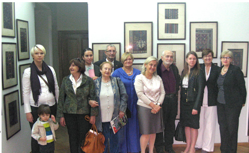
Gruzijas latviešu biedrības „Ave Sol!“ cilvēki, kuri piedalījās Jūlija Straumes darbu ekspozīcijas atklāšanā Muzeja jubilejas notikumos.