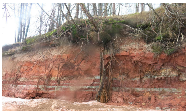
Vidzemes jūrmalas stāvkrausts.