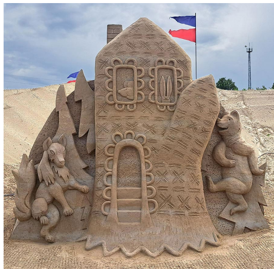
Aigars Zingniks. „Vecīša cimdīnš”. Žūrijas simpātijas balva.