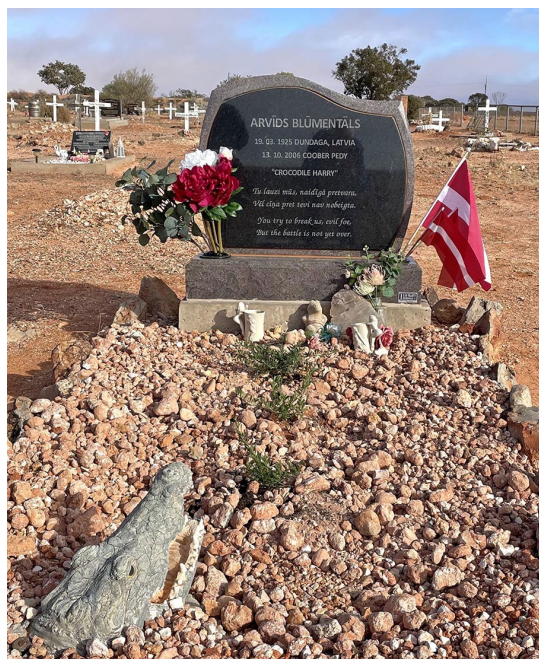
Arvīda Blūmentāla kaps ar jauno kapakmeni.