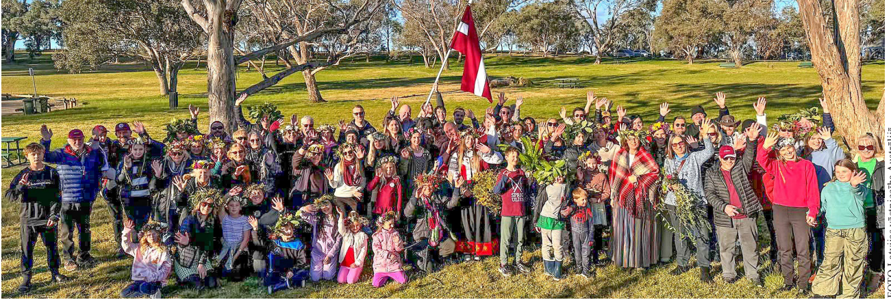
Līgotāji Kanberā. Skat. rakstu 5. lpp.