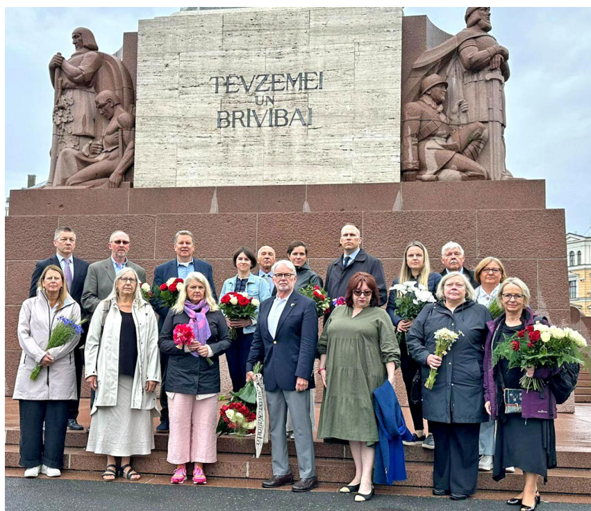
PBLA valde pie Brīvības pieminekļa Rīgā.

Piektdien, 14. jūnijā , Tautas sēru dienā, pieminot okupācijas varas upurus, PBLA valde nolika ziedus pie Brīvības un Gunāra Astras pieminekļiem, bet 15. jūnijā , sēdes nedēļas notikumu izskaņā, piedalījās Pasaules Latviešu mākslas centra 10 gadu jubilejas pasākumos Cēsīs.