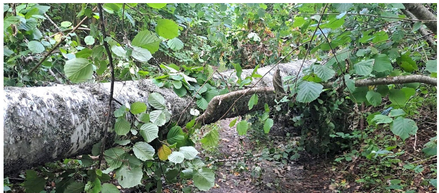
Vētrā nogāzies koks aizsprosto taku.

tikai ceru ka kāda mašīna viņu nesabrauks.