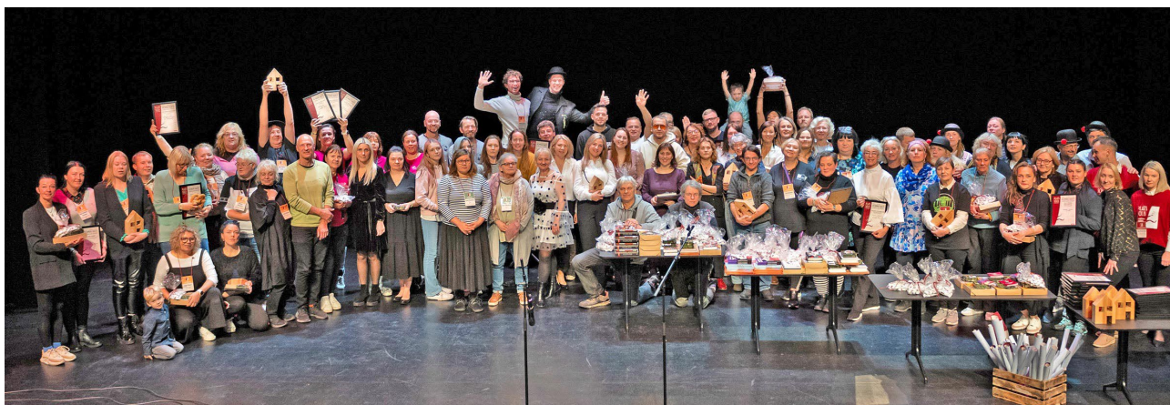
„PLATS Solis 2023“ noslēguma ceremonijas