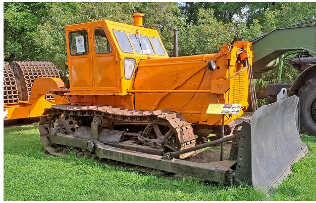
Eksponāts Latvijas Ceļu muzejā.

„Vasaras viducī zalkši rīko kāzas, un tajās piedalās vairāki īpatņi. Parasti kādā