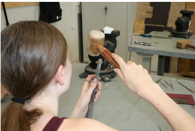
Pašam savs grezdens – ar rotkalšanu aizrāvās arī pusaudži.