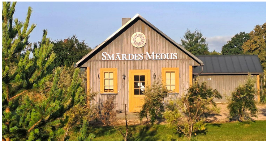
Veikals „Smārdes medus“.