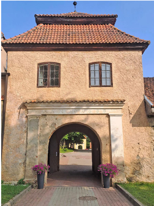
Šlokenbekas muižas vārti.

Turpat netālu sastopu uz ceļa sauli baudošu bezkājaino ķirzaku – glodeni. Izskatās, ka atradusi omulīgu vietu,