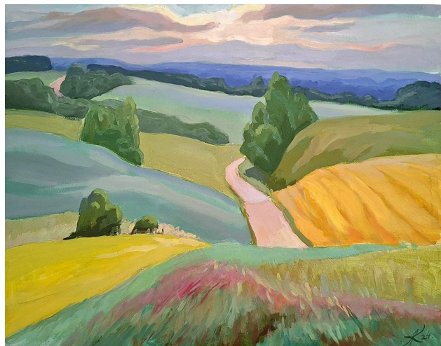
Agnese Krastenberga. „Sēlijas tāles“.