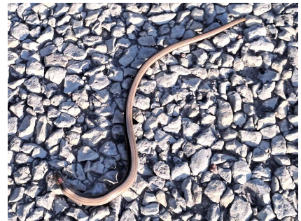
Glodene uz ceļa.

Šlokenbekas muiža. Šī ir vienīgā muiža Latvijā, kurai ir vēl saglabājušies viduslaiku aizsargvaļņi. Mūsdienās aiz brangajiem mūriem atrodas Latvijas Ceļu muzejs, kur var apskatīt dažādas senas ceļu veidošanas ierīces, kā arī viesnīca un kafējnīca.