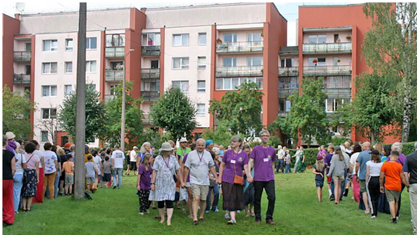
Limbažu 3x3 sākās ar dalībnieku Goda soli – visi iepazīnās dejā.