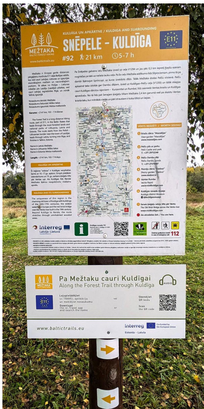
Informācijas stends par Mežtaku cauri Kuldīgai.