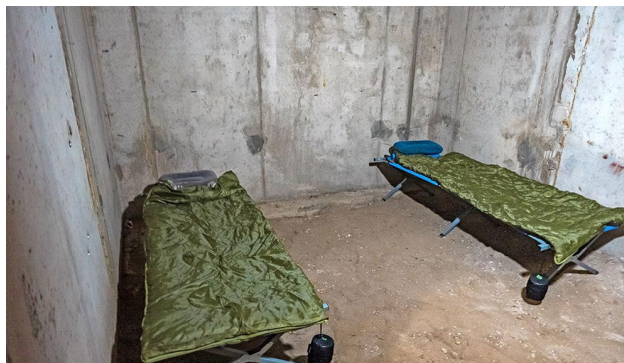
Droša patvēruma vieta Dreiliņu apkaimē.