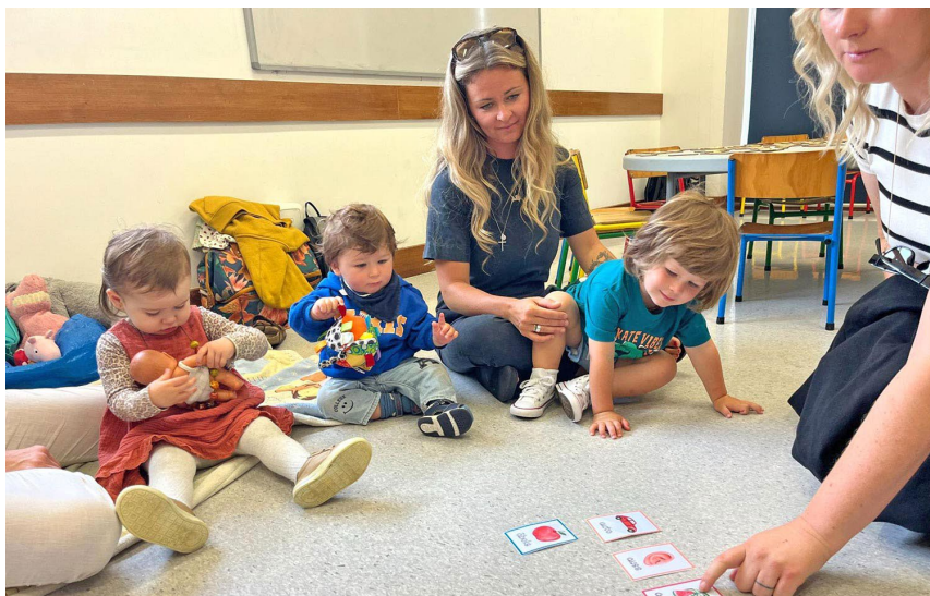
Baltā mākoņa Burtu skola.