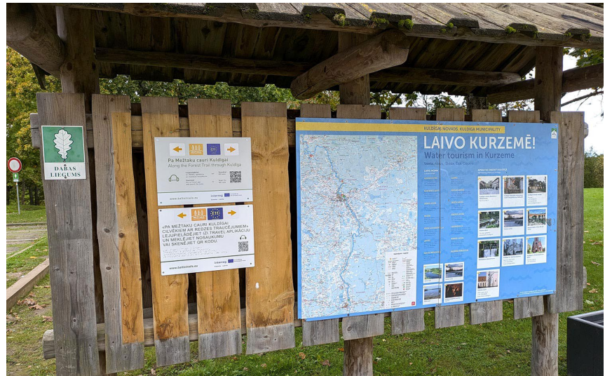
Informācijas stends par Mežtaku cauri Kuldīgai.

Šis ir pirmais specializētais audio gids garo pārgājienu takās – Mežtakā un Jūrtakā. Tā veidošanas pieredze izmantota vadlīnijās, kuras sniedz ieteikumus pārgājienu maršrutu izveidei dabā un to pielāgošanai cilvēkiem ar redzes traucējumiem. Vadlīnijas pieejamas saitē: https://baltictrails.eu/g/Res/Accessibility/