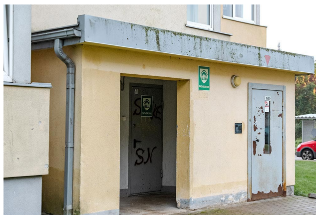
Droša patvēruma vieta Dreiliņu apkaimē.