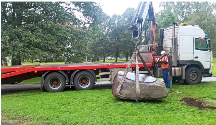
Latgales parkā demontē piemiņas zīmi – akmeni Maskavas dārza izveidei.