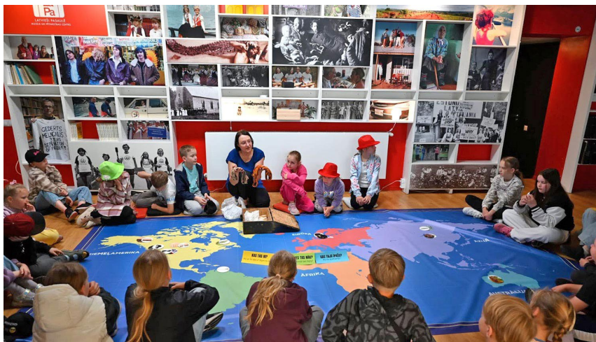
Pasākums muzejā „Latvieši pasaulē“.

Arī muzejs un pētniecības centrs Latvieši pasaulē ir privāts akreditēts muzejs, kas pastāv kopš 2007. gada un ir vienīgais muzejs pasaulē, kura galvenais uzdevums ir apkopot liecības, priekšmetus, fotogrāfijas un stāstus par latviešu izceļošanu no Latvijas un dzīvi diasporā kopš 19. gadsimta līdz mūsdienām. Septiņpadsmit gadu laikā muzejs, būdams nevalstiska organizācija ( biedrība), bez augstāk pieminētā Kultūras ministrijas bāzes finansējuma ir spējis pastāvēt un veikt profesionāla muzeja funkcijas – veidojot un arvien papildinot muzeja krājumu (šobrīd jau vairāk kā 32 000 vienību), īstenojot pētniecību un veicot aktīvu izglītojošu darbu sabiedrībā. Pa šo laiku ir sagatavotas vienīgas un labi apmeklētas izstādes Latvijas Nacionālajā bibliotēkā, Latvijas Dzelzceļa vēstures muzejā, Stūra mājā; tapušas divas dokumentālas pilnmetrāžas filmas Vārpa. Apsolītā zeme un Valiant! Brauciens uz brīvu Latviju , kā arī izdotas grāmatas (vairāk par muzeja dzīvi un darbības rezultātiem sk. muzeja tīmekļa vietnē www.lapamuzejs.lv ). Vairāki no šiem projektiem atzīti par vieniem no labākajiem Latvijā, saņemot Muzeju gada balvas nominācijas. 2020. gadā muzejs