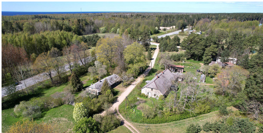
Blusu krogs un bijuši bode (Gaitnieki) skatā no D. Skultes pagasts, Limbažu novads. 2023. g. 6. maijs.