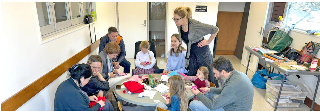
Baltā mākoņa Burtu skola.