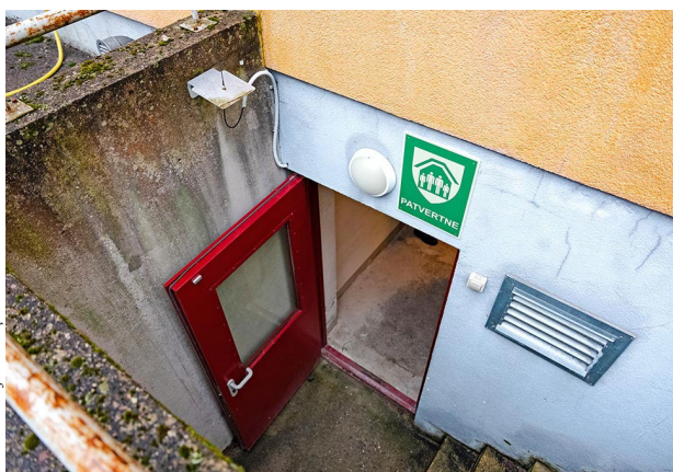
Droša patvēruma vieta Dreiliņu apkaimē.