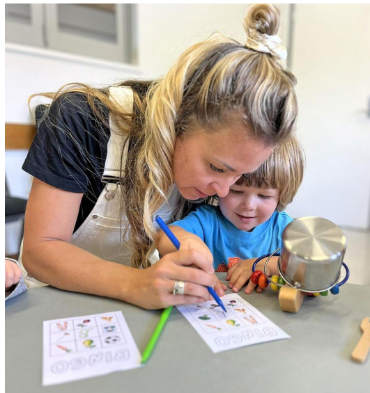
Baltā mākoņa Burtu skola.