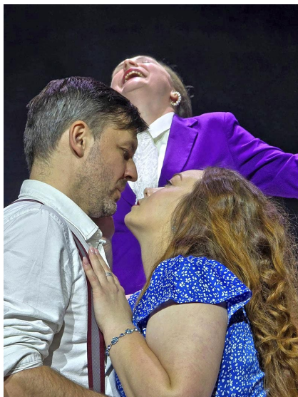
Skats no izrādes „Aiz durvīm“.

Kortjarda teātris atrodas Hokstonā (Hoxton), kas ir zināms kā viens no radošākajiem un dinamiskākajiem Londonas rajoniem, kur notiek dažādi mākslas projekti, tāpēc Latviešu Kultūras centrs Birminghamā izvēlējās šo vietu kā starta punktu radošajam ciklam Teātris bez robežām (angliski – Theatre without borders ), kurā kā pirmās rādīs izrādes ar latviešu aktieru un mākslinieku dalību no piecām valstīm.