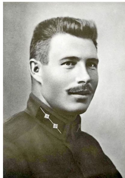
Pulkvedis Oskars Kalpaks 1919. gadā.

No šī brīža sākās tās atmoda. Tauta bija ieguvusi palāvību uz saviem