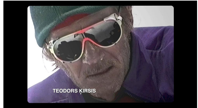
Kadrs no filmas.