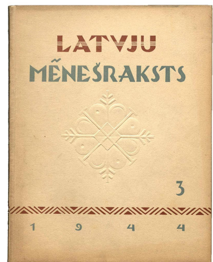
Žurnāla „Latvju Mēnešraksts“ Nr. 3, 1944 vāks.