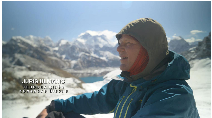
Kadrs no filmas.