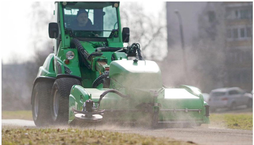
Traktors savāc smiltis no ielas.

Pašvaldība uzsver, ka vēl ir iespējams gan sals, gan sniegs, tādēļ darbi norit lokāli, tikai dienas laikā, kad gaisa temperatūra pārsniedz 0 grādus un ir piemērota darbu veikšanai. Sekojot līdzī laika prognozei, ielu uzkopšanas darbi jebkurā brīdī var tikt pārtraukti un atsākti, iestājoties labvēlīgiem laika apstākļiem. Ja ir iespējams, darbi tiek veikti arī naktis